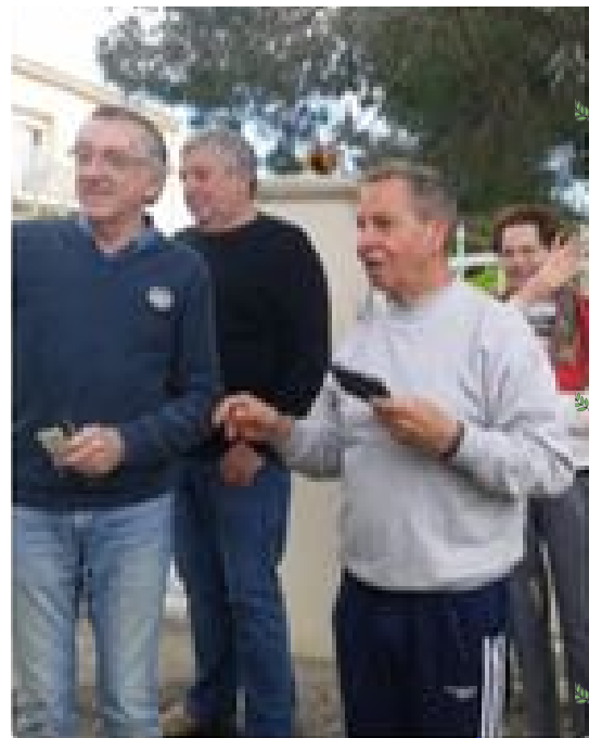
16.02.26 en souvenir de maman